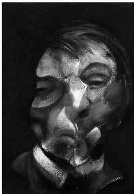
Francis Bacon, Self-portrait, olio su tela, 1971, Paris, Louise and Michel Leiris Collection