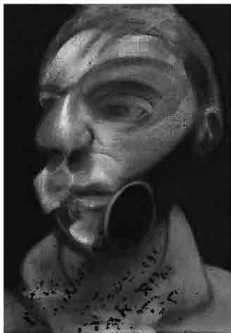
Francis Bacon, Self-portrait, olio su tela, 1975, collocazione incerta, collezione privata