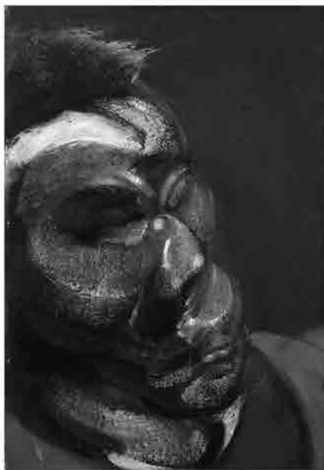
Francis Bacon, Three studies for a self-portrait, particolare, olio su tela, 1967, Germania, collezione privata