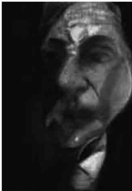
Francis Bacon, Study for self-portrait, olio su tela, 1979, collocazione incerta, collezione privata