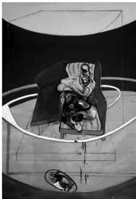
Francis Bacon, Study for portrait on folding bed, olio su tela, 1963, London, The Tate Gallery