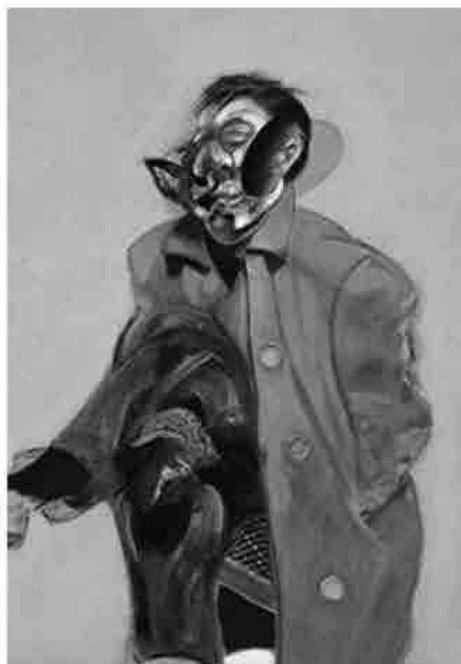
Francis Bacon, Self-portrait, olio su tela, 1970, London, collezione privata