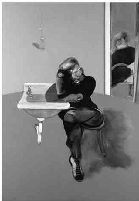
Francis Bacon, Self-portrait, olio su tela, 1973, collocazione incerta, collezione privata Francis