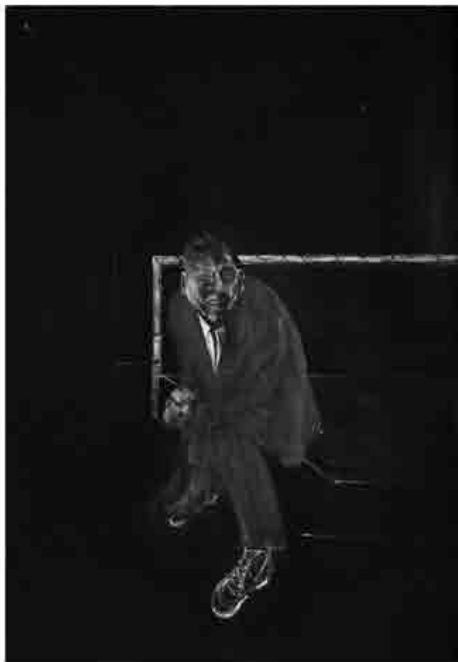
Francis Bacon, Self-portrait, olio su tela, 1956, collocazione incerta, collezione privata