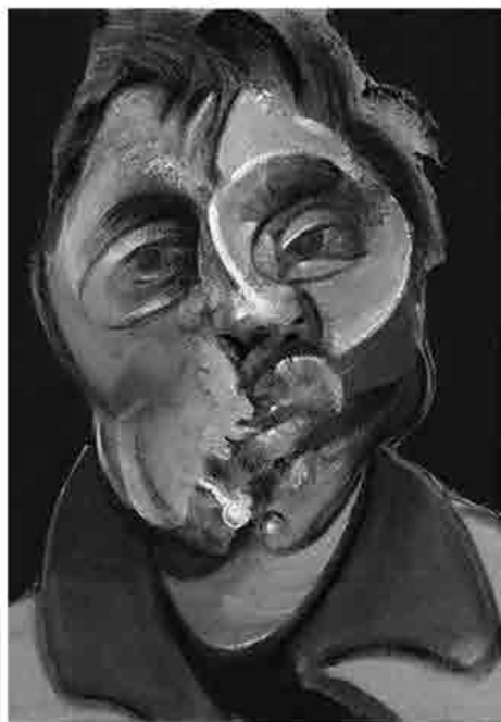
Francis Bacon, Self-portrait, olio su tela, 1969, London, collezione privata