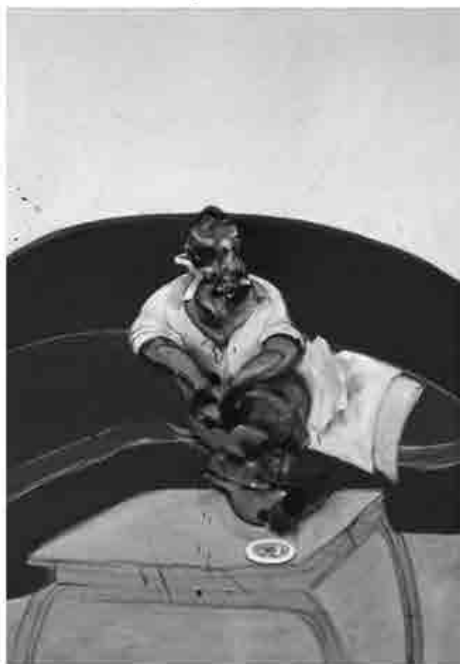
Francis Bacon, Self-portrait, olio su tela, 1963, London, collezione privata