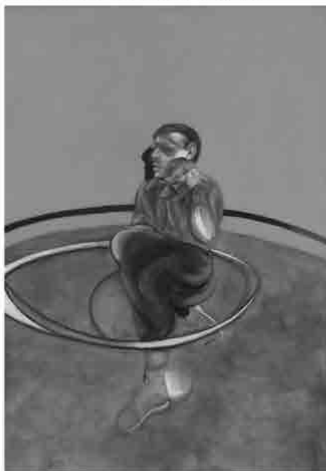
Francis Bacon, Self-portrait, olio su tela, 1978, collocazione incerta, collezione privata