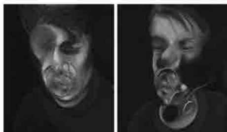
Francis Bacon, Two studies for self-portrait, olio su tela, 1977, collocazione incerta, collezione privata