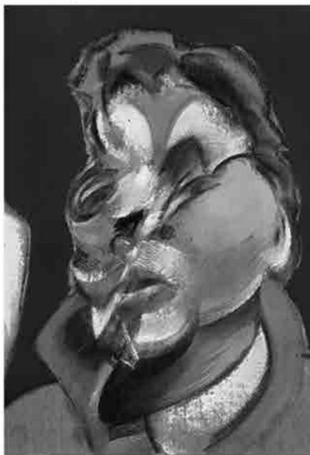
Francis Bacon, Three studies for portraits (including self-portrait), olio su tela, 1969, Pavia, collezione privata