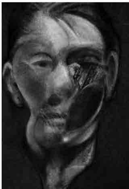
Francis Bacon, Self-portrait, olio su tela, 1976, Marsiglia, Musée Cantini