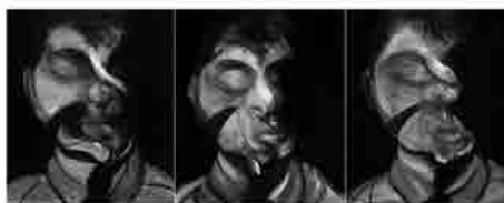
Francis Bacon, Three studies for self-portrait, olio su tela, 1973, collocazione incerta, collezione privata