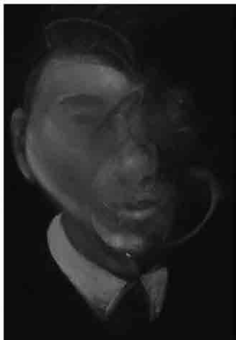
Francis Bacon, Study for self-portrait, olio su tela, 1980, collocazione incerta, collezione privata