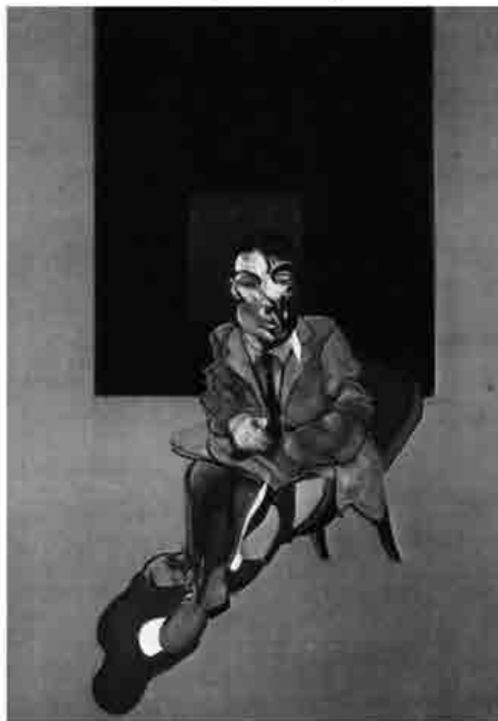
Francis Bacon, Self-portrait, olio su tela, 1972, collocazione incerta, collezione privata