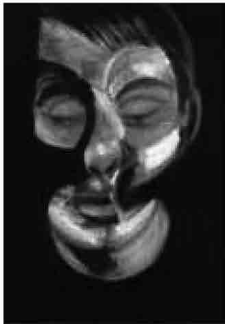
Francis Bacon, Self-portrait, olio su tela, 1972, collocazione incerta, collezione privata