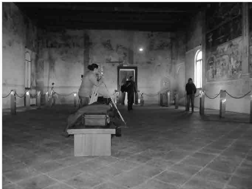
La stazione totale Leica Ter 1103 .