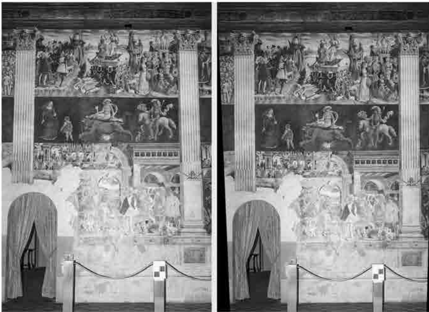
Fotogramma prima e dopo il raddrizzamento.

Per l'acquisizione fotogrammetrica è stata utilizzata una macchina fotografica Nikon D800 con ottiche 21 e 50 mm. Per consentire il ricoprimento di ciascun lato, garantendo la produzione di rilievi alla scala 1:20, sono state effettuate delle strisciate fotogrammetriche con asse ottico perpendicolare ad ognuna delle pareti. A causa delle condizioni di illuminazione non ot-