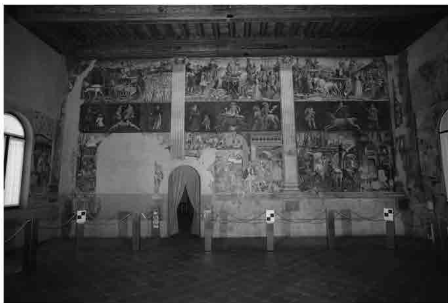
Il sistema di segnalizzazione adottato per il rilievo del Salone dei Mesi.