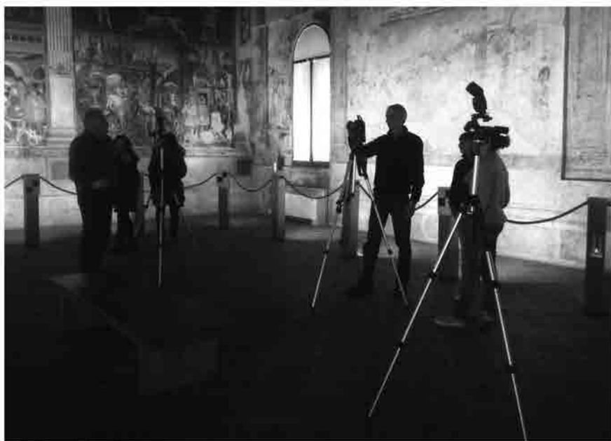
Acquisizione dei fotogrammi.

In fase di processamento, il software di gestione delle scansioni riconosce facilmente alcune tipologie di segnalizzazione; per questo motivo sono stati posizionati lungo tutto il perimetro della stanza 14 target a scacchiera ad elevato contrasto. La risoluzione di acquisizione delle scansioni è stata impostata per ottenere un punto ogni 3 mm a 10 metri di distanza con un passo angolare di 0.018^\circ . Per ottenere un modello numerico completo e per ridurre al minimo le zone d'ombra (ossia dove il dato metrico non viene acquisito) sono state realizzate sei scansioni. Il rilievo laser scanning consente di ottenere un insieme di coordinate tridimensionali dell'oggetto, in un sistema di riferimento correlato con lo strumento. Per georeferenziare tutte le scansioni nello stesso sistema di riferimento è stato realizzato un appoggio