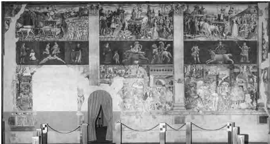
Modello 3D texturizzato.

Analizzando le ortofoto con i valori radiometrici, è possibile notare la differenza di luminosità tra la parte bassa e la porzione sommitale delle pareti, con la successiva impossibilità di leggere con chiarezza alcuni dettagli delle rappresentazioni; la tecnica fotogrammetrica del raddrizzamento applicata in questo caso si è rivelata quindi fondamentale per permettere le analisi necessarie sugli affreschi.