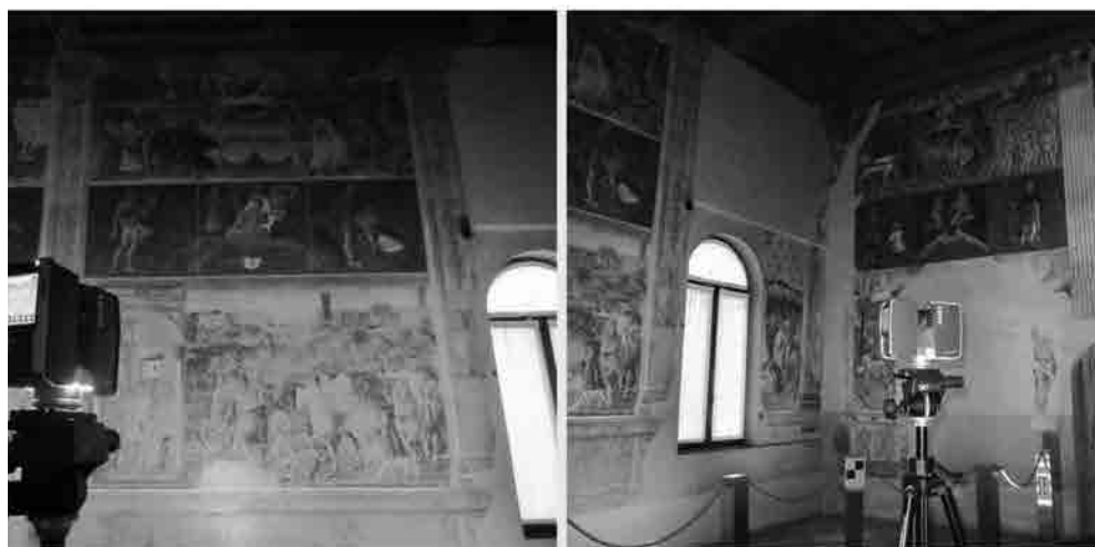
Il laser scanner a differenza di fase Faro Focus 3D .

Le scansioni all'interno del Salone dei Mesi sono state realizzate con il laser scanner a differenza di fase Faro Focus 3D . Questo laser scanner è caratteriz-