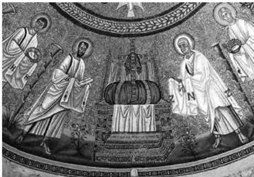
Etimasia , Battistero degli Ariani, V-VI sec., Ravenna

lo stare seduti su una sedia, su uno sgabello, su un trono, su un fiore di loto o sul corpo arrotolato di un serpente a nove teste, ha sempre significato assumere un ruolo eminente, che neppure la posizione eretta possiede. A riprova di ciò, nell'iconografia buddhista, ma anche in quella cristiana, un seggio vuoto (o come nel caso della cupola del Battistero degli Ariani a Ravenna, occupato da una croce di gemme) può sostituire la figura del Buddha o quella di Cristo, divenendo esso stesso oggetto di adorazione.