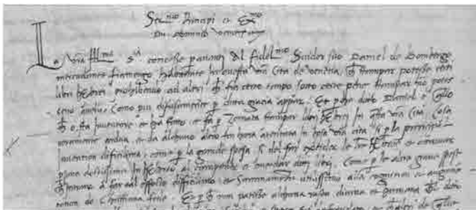
Privilegio di Daniel Bomberg per la stampa con caratteri ebraici, 1515, ASVe, Collegio, Notatorio, reg. 18, c. 24r (= 25r).