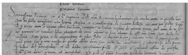
Privilegio di Aldo Manuzio per la stampa di testi con caratteri corsivi, 1501, ASVe, Collegio, Notatorio, reg. 15, c. 40r (= 42r).