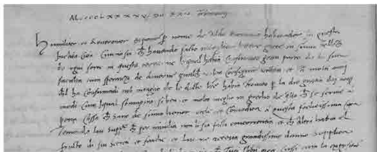
Privilegio di Aldo Manuzio per la stampa di testi con caratteri greci, 1496, ASVe, Collegio, Notatorio, reg. 14, c. 133v (=137v).

Nella selezione veneziana spiccano il già citato privilegio in latino concesso a Giovanni Spira del 1469, che ci mostra un atteggiamento ancora un po' vago del governo veneziano nei confronti di "tale inventum, aetatis