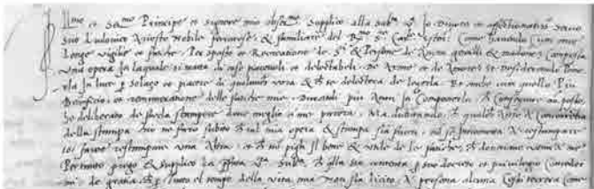
Privilegio di Ludovico Ariosto per la stampa dell’ Orlando Furioso , 1515, ASVe, Collegio, Notatorio, reg. 18, c. 23r (= 24r).

Un passo avanti nella tutela del diritto viene compiuto con il decreto sui ‘brevetti’ passato in Senato nel 1474, nel quale si sottolinea che la sua applicazione è indirizzata a “algun nuouo et ingegnoso artificio, non facto per avanti nel Dominio nostro”. In quest’ottica spiccano il privilegio per la stampa della musica (“canto figurado”) di Ottaviano Petrucci nel 1498 e quello per il testo dell’ Orlando Furioso chiesto da Ludovico Ariosto nel 1515. Va notato come l’Ariosto, in questo caso, non stia chiedendo il privilegio per stampare il suo testo a Venezia, ma, al contrario, la garanzia che “à concorrenza della stampa ch’io me farò subito” nessuno “si intrometta a restampare [...] et che non pigli il bene et utile de le fatiche, che doveriano venire à mé”: l’autore sta tutelando cioè non soltanto i diritti editoriali, quanto anche quelli relativi alla propria opera d’ingegno. L’ editio princeps dell’ Orlando Furioso , che uscì a Ferrara nel 1516 (sui 500 anni della pubblicazione la mostra di Ferrara in questo stesso numero di “Engramma”),