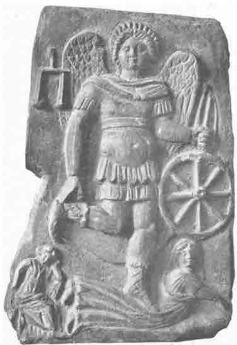
Kairos (Occasio)? , lastra a bassorilievo copta, III-IV secolo, Il Cairo, Museo Nazionale.

Più controversa è l'identificazione della scena scolpita a bassorilievo su una lastra in pietra calcarea, originaria di Tebe e oggi conservata presso il Museo del Cairo, databile al III/IV sec. – e quindi all'incirca coeva di Ausonio. Una parte della critica (Strzygowski 1904; Polito 1992; Zaccaria Ruggiu 2006; Mattiacci 2011) la ritiene una rappresentazione di Kairos , Pronoia e Metanoia , identificando Kairos con la figura principale, alata, che indossa una veste militare, stringe nella mano sinistra una ruota radiata, ed