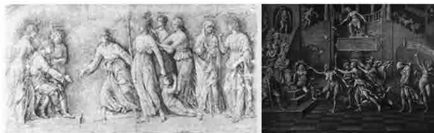
Andrea Mantegna, Calunnia d'Apelle , disegno, 1504-1506 ca.