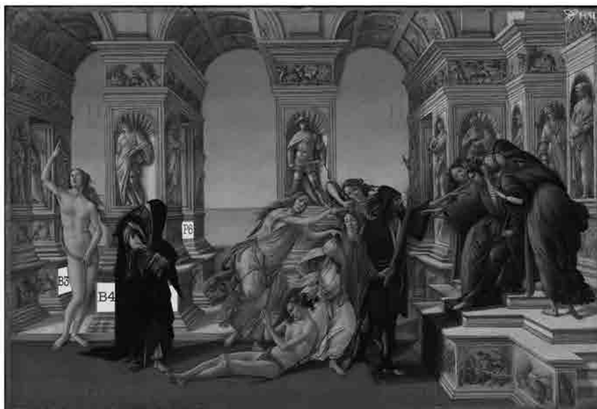
Schema della Calunnia : in giallo la posizione del riquadro B3, B4 e P6.

Prima di concludere questo contributo, vorrei tornare su una questione. Quando Ficino parla dei melanconici si riferisce unicamente agli intellettuali: teologi, poeti e filosofi. Secondo l'umanista infatti solo la mens intuitiva – l'unica delle facoltà umane puramente metafisica e pertanto la più elevata – può ricevere le influenze ispiratrici di Saturno. La ratio discorsiva, che governa la sfera dell'azione morale e politica appartiene a Giove, e la imaginatio , che guida la mano dell'artista e dell'artigiano appartiene a Marte o al Sole (Rius 1987, 39). Secondo Ficino l'influsso di Saturno induce una contemplazione sublime, divina, propria degli uomini di genio, e degli intellettuali. Nella Calunnia di Botticelli, invece, Melanconia , travestita nell' habitus di Metanoia/Paenitentia , predispone gli uomini al ravvedimento che passa per l'iniziazione amorosa (Cimone) ma plasma anche il cittadino esemplare.