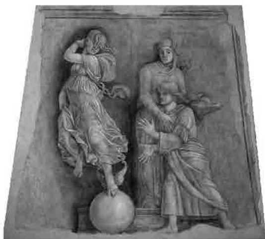
Bottega di Mantegna, Occasio e Paenitentia , affresco, 1500-1505. Mantova, Museo della Città, Palazzo di S. Sebastiano.

Leggermente diverso è il caso dell'affresco monocromo di scuola mantegnesca che ornava il camino della dimora mantovana del