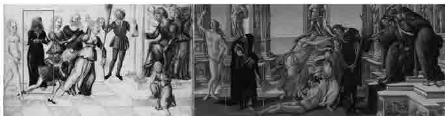
Bartolomeo Fonzio, Metanoia/Paenitentia (particolare dalla Calunnia ), miniatura su pergamena, 1472. Berlino, Staatliche Museen, Kupferstichkabinett, cod. 78.C.26, frontespizio.