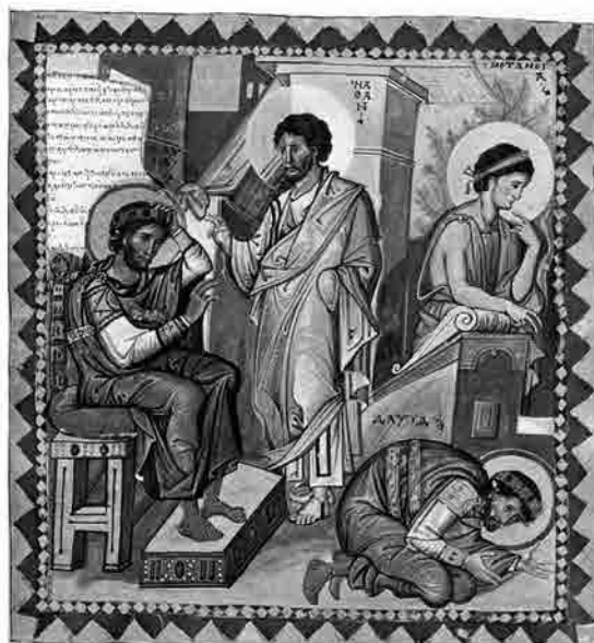
Rimproveri di Natan e pentimento di David. Salterio greco di Parigi, X sec. Parigi, BNF, Ms. Grec 139, fol. 136v.

ha a fianco una piccola bilancia; Pronoia con la figura femminile distesa sotto i suoi piedi in atto di portarlo in volo; e Metanoia con la figura femminile penitente, scolpita nell'angolo inferiore sinistro del rilievo che, seduta, si sorregge la testa con la mano sinistra. Diversa l'interpretazione di Paul Perdrizet (1912), accolta da Arthur Bernard Cook (1925) e da Giovan Battista D'Alessio (1995), che identifica la figura alata con Nemesis e quella distesa con Hybris , pur confermando la presenza di Metanoia .