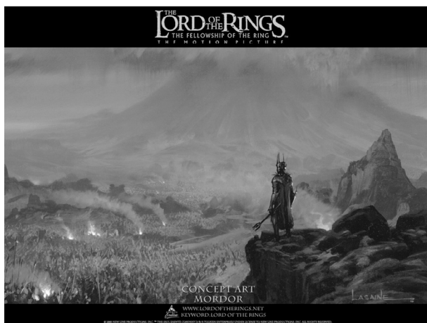
Paul Lasaine, Mordor: la pianura di Gorgoroth. Sauron contempla le sue truppe , bozzetto per il film Il signore degli anelli. La compagnia dell'anello , USA / Nuova Zelanda 2001