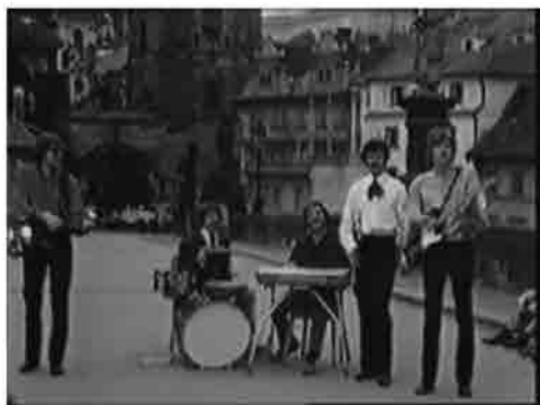
I Moody blues a Praga durante la Primavera

al suicidio seriale delle icone del '68, in Cecoslovacchia la parola e la lingua ceca stessa venivano sottratte nell'impatto con la realtà della russificazione del paese.