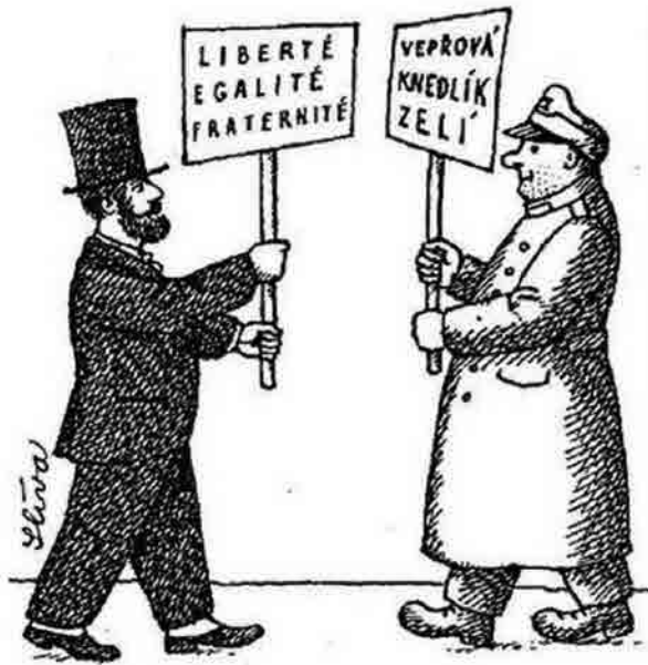
Il buon soldato švejk inneggia a "arrosto di porco, knödel, cavolo".

lo spettro di Sc'veik non è meno presente nella strade di Praga. Qualche tempo dopo l'invasione russa, nel 1968, ho assistito ad una grande assemblea di studenti. Aspettavano Husak, il nuovo capo del Partito, imposto dai russi, che doveva parlare loro. Husak non è neppure riuscito ad aprire bocca, perché tutti si sono messi a scandire: "Viva Husak! Viva il Partito!". E' durato cinque minuti, dieci, un quarto d'ora e Husak, il volto sempre più paonazzo, è stato costretto ad andarsene. È sicuramente lo spirito di Sc'veik che ha suggerito agli studenti quell'applauso indimenticabile.