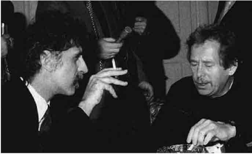
Frank Zappa con il presidente Havel

Andy was a Catholic, the ethic ran through his bones he lived alone with his mother, collecting gossip and toys Every Sunday when he went to Church he'd kneel in his pew and say, "It's just work".