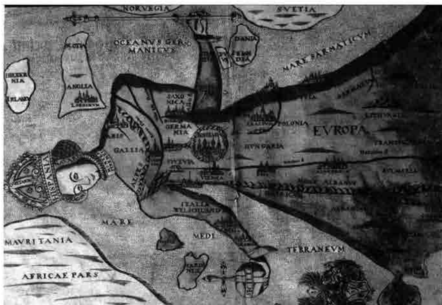
Heinrich Bünting, Europa in forma Virginis (1592)

Meglio di altre, le prospettive surrealistiche sono un modo per accostarsi a questo luogo possibile, alla configurazione di qualcosa che non ha nome, posto 'entre-deux', metaxy , tra due luoghi e due mondi: Čechy, Bohemia, Böhmen , per arrivare all'attuale strana doppia denominazione attuale (Repubblica 'ceca'),