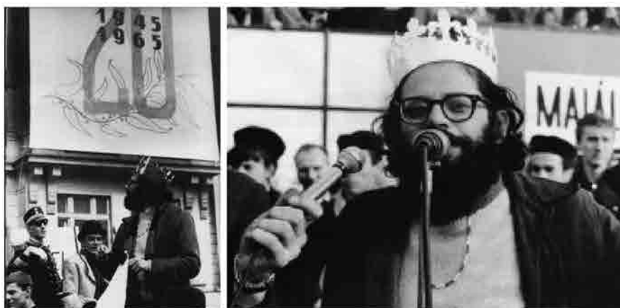
Allen Ginsberg incoronato 're di maggio'.