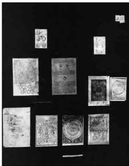
Aby Warburg, Mnemosyne, tavola 23a Franz Boll, Sphaera , Leipzig, B. G. Teubner 1903, p. 470