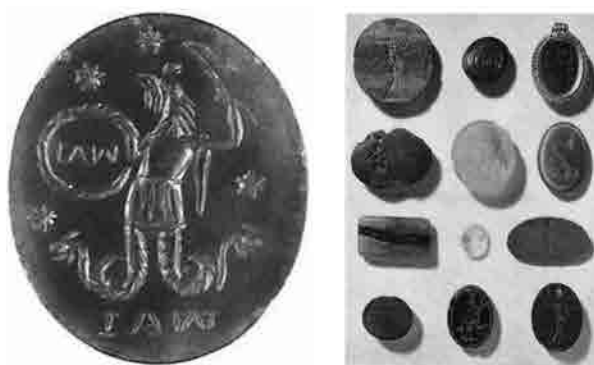
Abraxas "anguipede alectorcéphale" (Delatte, Derchain 1964, pp. 23-25) inciso su eliotropo ovale, tronco-conico piano, III secolo d.C., Bologna, Museo Civico Archeologico. Intagli magici, da Delatte, Derchain 1964.

L'antichità ci ha lasciato – accanto a splendide e preziose pietre incise, quelle che per primi catalogarono Goorle, Maffei e Mariette – un gran numero di pietre semi-preziose (e anche di nessun valore), dove sono intagliate spesso grossolanamente figure mostruose accompagnate da scritte misteriose. I primi a studiare questi materiali, insieme parerga e potenti indicatori culturali, furono due eruditi del XVII secolo, Macarius e Chiflet, curatori del volume Abraxas scelto da Warburg per la tavola 23a. Per lungo tempo si pensò che i culti legati a queste pietre avessero avuto origine all'interno della setta gnostica di Basilide nata ad Alessandria d'Egitto nel II secolo d.C. e diffusasi in tutto il Mediterraneo. In un certo numero di esemplari si trova il termine 'Abraxas' iscritto sulla gemma, accanto all'immagine di una creatura ibrida, con testa di gallo, corpo di uomo e due serpenti al po-