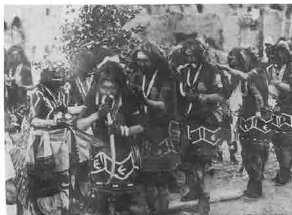
Una fase del rituale del serpente presso la tribù indiana Hopi, 1896

Nell'immagine XVIII sono invece raffigurati amuleti che dovettero interessare Warburg in relazione alle ricerche sul culto del serpente, animale dal potente e ambiguo potere evocativo, curatore e assassino, "bacchetta magica semantica" (Cestelli Guidi, Mann 1998): per ventisette anni, a partire dal viaggio in Arizona fino all'esposizione del 1923 dal titolo Immagini della regione degli indiani Pueblo nel Nord-America , uno degli argomenti di riflessione di Warburg.