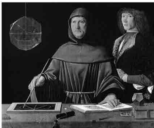
Jacopo de' Barbari (attr.), Ritratto di fra' Luca Pacioli con un allievo, 1495 ca., Napoli, Museo Nazionale di Capodimonte

Secondo l'erudito François Gruget, curatore dell'edizione cinquecentesca del gioco divinatorio, il dodecaedro è la forma più perfetta, una sorta di micro-rappresentazione del globo terrestre, anche perché contiene nel proprio numero i dodici segni zodiacali che percorrono la circonferenza del cielo. I poliedri del resto già dal XV secolo erano fra gli argomenti eccellenti dell'umanesimo matematico (Field 1997, pp. 241-289). Anche Luca Pacioli aveva