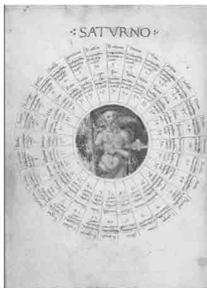
Saturno, da Lorenzo Spirito Gualtieri, Libro delle Sorti , Biblioteca Nazionale Marciana, It. IX, 87 (=6226). Saturno, da Lorenzo Spirito Gualtieri, Libro delle Sorti , Perugia, Stephan Arndes 1482.