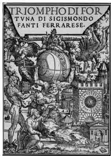
Sigismondo Fanti, Triompho di Fortuna, Venezia, Giunta 1527. Frontespizio su disegno di Baldassarre Peruzzi.

L'inventore delle sorti nella variante rinascimentale è Lorenzo Gualtieri detto Spirito (1422-1496). Era ironico e sferzante come Boccaccio (fu scomunicato per vilipendio nei confronti del clero), mentre cantava il suo amore per Fenice alla maniera di Petrarca. Non disdegnava i classici, fu infatti il secondo traduttore in volgare di Ovidio, ed era anche un miniatore. Scritto e firmato nel 1482, il manoscritto conservato alla Biblioteca Nazionale Marciana (It. IX, 87 (=6226)) e pubblicato per la prima volta da Warburg in tavola 23a, dovette riposare nei recessi di una biblioteca signorile