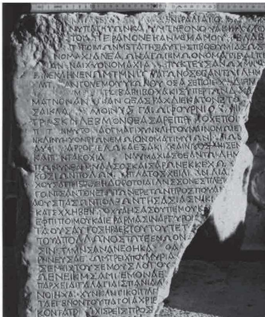
Res Gestae Divi Augusti , dettaglio dal testo epigrafico in greco (da Apollonia)

βωμόν Ειρήνης Σεβαστῆς ὑπὲρ τῆς ἑμῆς ἐπανόδου ἀφιερωθῆναι ἐψηφίσατο ἢ σύνκλητος ἐν πεδίοις Ἄρεως, πρὸς ᾧ τοὺς τε ἐν ταῖς ἀρχαῖς καὶ τοὺς ἱερεῖς τὰς τε ἱερείας ἐνιαυσίους θυσίας ἐκέλευσε ποιεῖν.