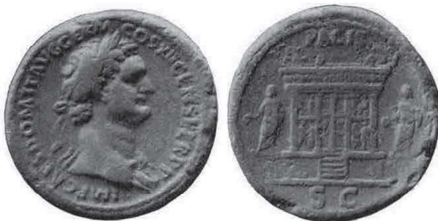
Asse di Domiziano, 86 d.C.: sul verso, il fronte ovest dell'Ara Pacis Augustae