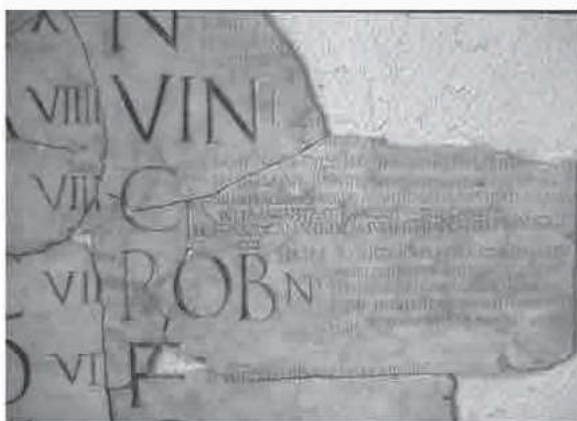
Fasti Praenestini , dettaglio del testo epigrafico (Roma, Museo Nazionale Romano)

Cum ex Hispania Galliaque, rebus in iis provinciis prospere gestis, Romam redi, Ti. Nerone P. Quintilio consulibus, aram Pacis Augustae senatus pro reditu meo consacranda censuit ad campum Martium, in qua magistratus et sacerdotes virginesque Vestales anniversarium sacrificium facere iussit.