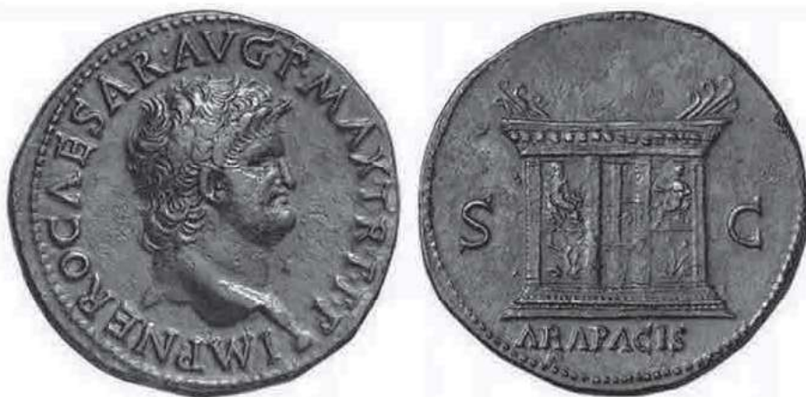
Sesterzio di Nerone, post 66 d.C.: sul verso, il fronte est dell'Ara Pacis Augustae